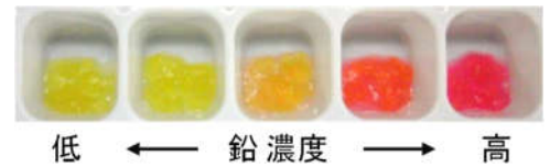
図2 検出剤の色の变化

これは分析機器や専任のオペレータを必要とせず、現場での迅速な検出が可能で、土壌汚染評価に要する時間や費用の低減が期待できます。本製品の実用化に向けて、様々な土壌に対応できる固体材料の開発及び検出精度の向上を目指しています。