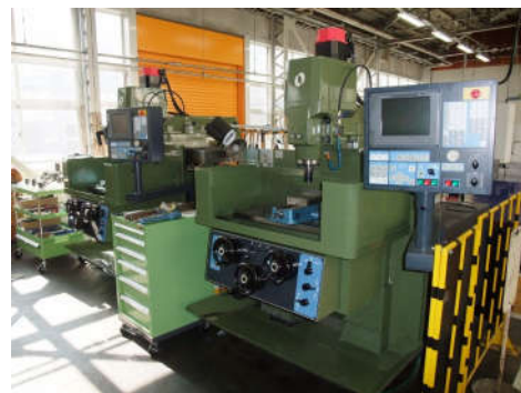
操作フライス盤(牧野フライス KE-55)