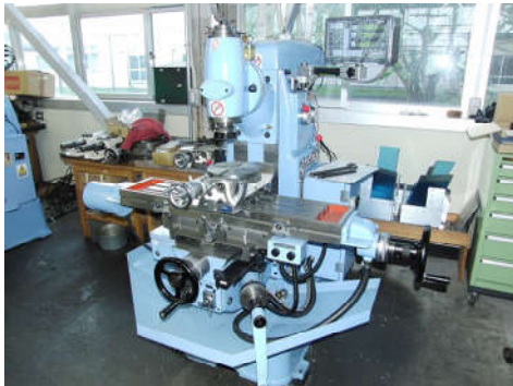
汎用フライス盤(イワシタ NK-1)