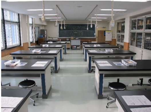
ノギスとマイクロメーターによる長さの測定