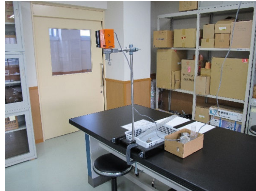
重力加速度の測定