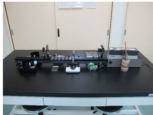
レーザー光による光の干渉と回折