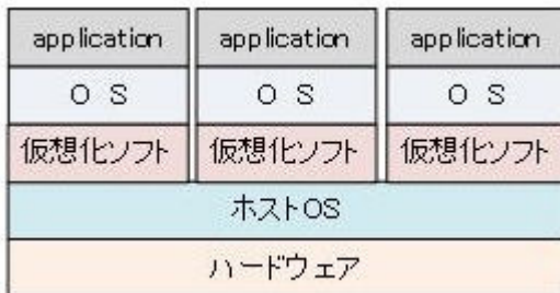
ホスト OS 型