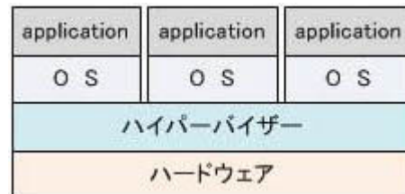
ハイパーバイザ型