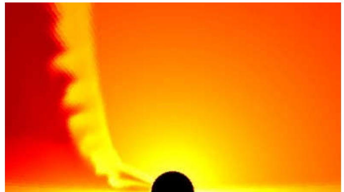
ブラックホールを襲う流体衝撃波を飲み込むブラックホール

(一般相対性理論が正しければ、ブラックホールはこのような暗い影が見えると考えられています)